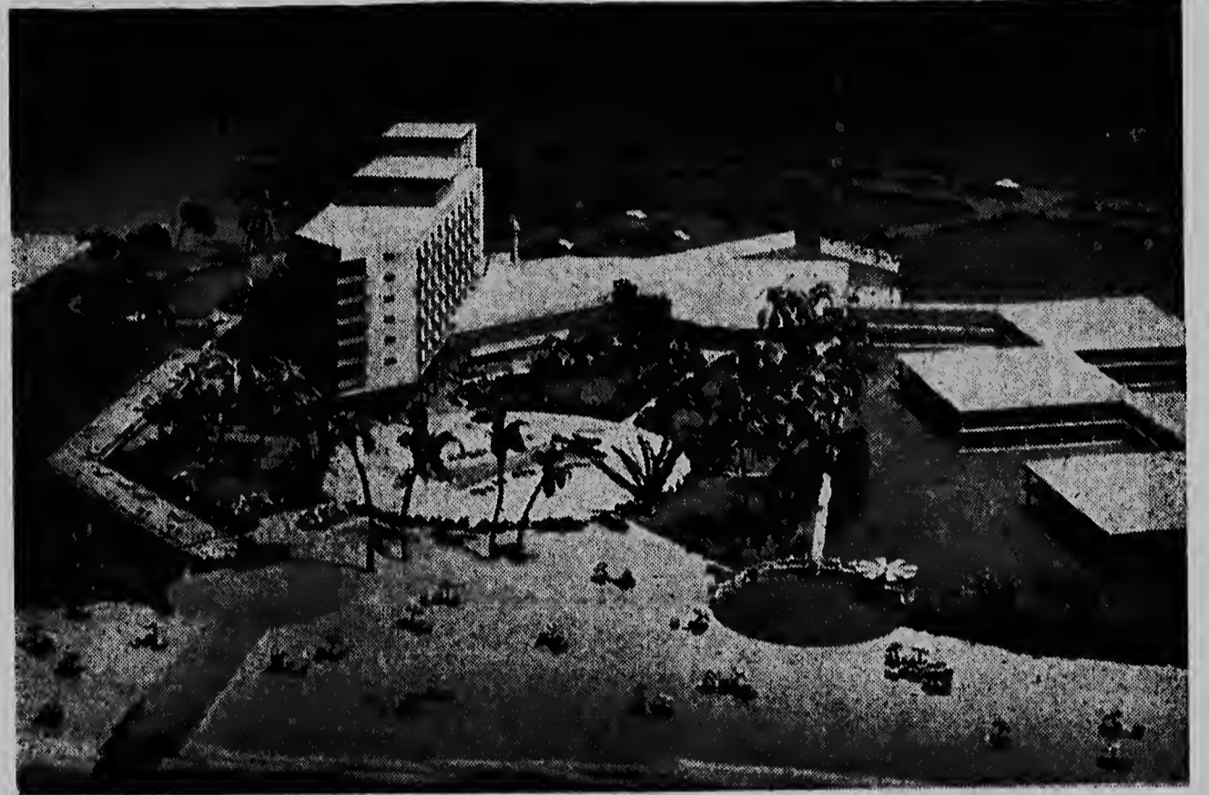
Esaki ta un bista mas di Aruba Caribbean Hotel mira for di banda di laman.